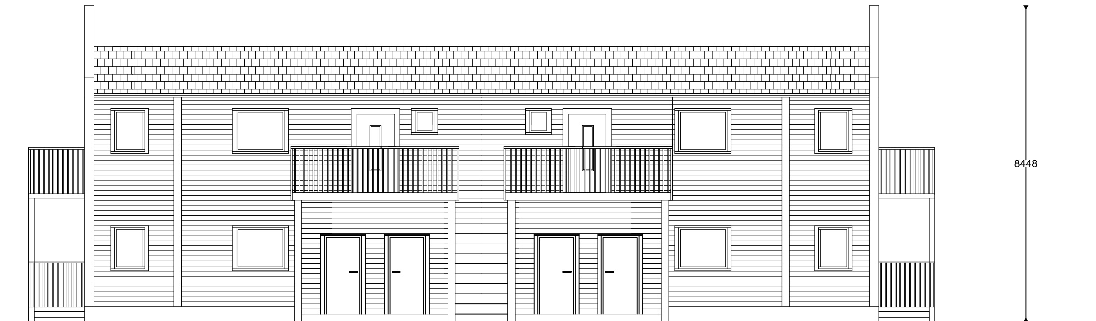
FASAD MOT GÅRD

Entredörrar - mörkgrå utförande likt Nordan "Kvadraten 839G3" Förrådsdörrar - standard vit